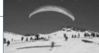
Coupe du monde parapente

Bien que la météo ne se soit pas montrée très favorable (particulièrement pour les terrasses de nos restaurants), les fêtes de Noël ont été une réussite avec une clientèle fort surprise des bonnes conditions de ski et ravie des investissements réalisés en 2002 (voir Funi'Mag de décembre 2002).