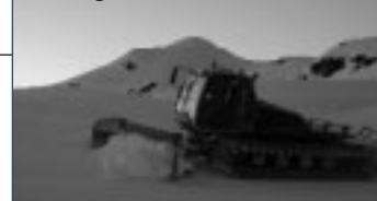
Damage au Prilet

Il nous laisse le souvenir d'un collègue de travail particulièrement jovial et chaleureux.