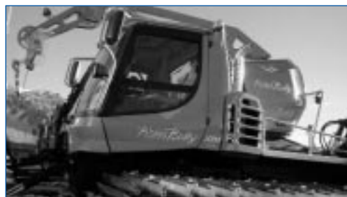
automne 2004 nouvelle dameuse-treuil Kässbohrer

A l'aube d'une nouvelle saison d'hiver, notre équipe technique se réjouit de vous accueillir sur nos installations.