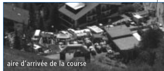
aire d'arrivée de la course

Le Mountain Bike et l'Arapaho ont encore de beaux jours devant eux et nous souhaitons continuer de les développer à St-Luc/Chandolin comme dans tout le Val d'Anniviers. Rendez-vous l'été prochain !